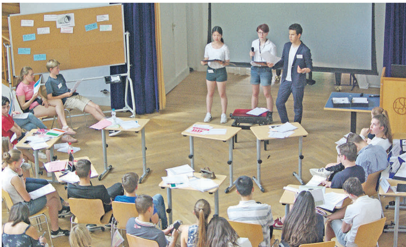
Zwei Tage lang schlüpfen die Schüler in die Rollen von Politikern, Staatenlenkern und Vertretern von Organisationen.

Zusammen wurde hitzig über einen Lösungsweg aus der griechischen Wirtschafts- und Finanzkrise des Jahres 2012 diskutiert. Den Schwerpunkt der finalen Debatte stellte vor allem die Beibehaltung der schwierigen Balance zwischen der Selbstständigkeit Griechenlands sowie dem Anspruch auf solidarische Unterstützung seitens der restlichen Eurozonen-Länder dar. Einigkeit herrschte auf allen